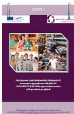
EZINE - I INCONTRO DUBLINO