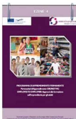
EZINE - IV INCONTRO DUBLINO