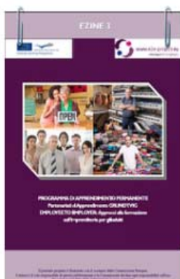
EZINE - III INCONTRO OSTRAVA