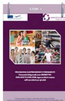
EZINE - V INCONTRO AVELLINO