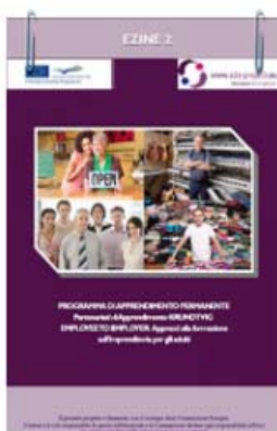
EZINE - II INCONTRO BELFAST